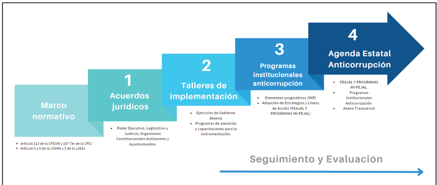
Gráfico 2. Ruta Integral de Implementación de la PEAJAL