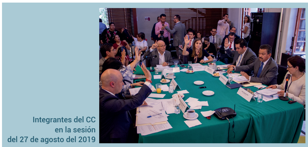
Integrantes del CC en la sesión del 27 de agosto del 2019

En ambos grupos, las actividades pueden ser propuestas, conforme a sus facultades y atribuciones, por la Comisión Ejecutiva de la Secretaría Ejecutiva del SEAJAL, por los integrantes del Comité Coordinador o por la Secretaría Técnica de la SESAJ. También, pueden surgir de los acuerdos que se tomen por parte de las instancias integrantes del Sistema Nacional Anticorrupción o bien, de necesidades de interacción con el Gobierno del Estado u otros entes públicos.